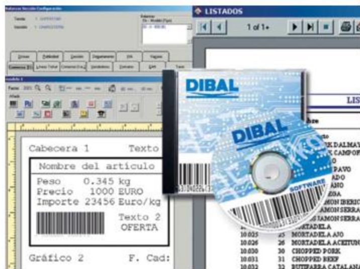
Tabella dei modelli